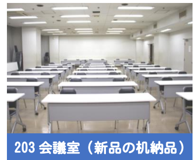
203 会議室 (新品の机納品)