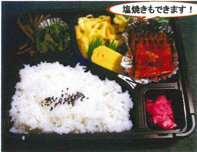
お茶付き弁当(さば味噌煮)600円

ごはん 漬物 さば味噌煮 野菜のかき揚げ 玉子焼き 菜の花ゴマ和え きんぴらごぼう 他