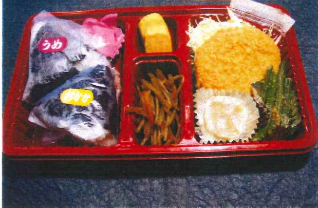
お茶付き弁当(おにぎり)600円

おにぎり2個 漬物 玉子焼き きんぴらごぼう コロッケ シュウマイ いんげんゴマ和え 他