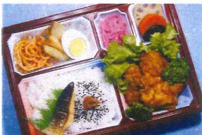
鶏の唐揚げ弁当 780円