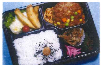
ハンバーグ弁当 670円