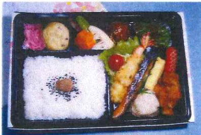
鵜原 (うばら) 870円