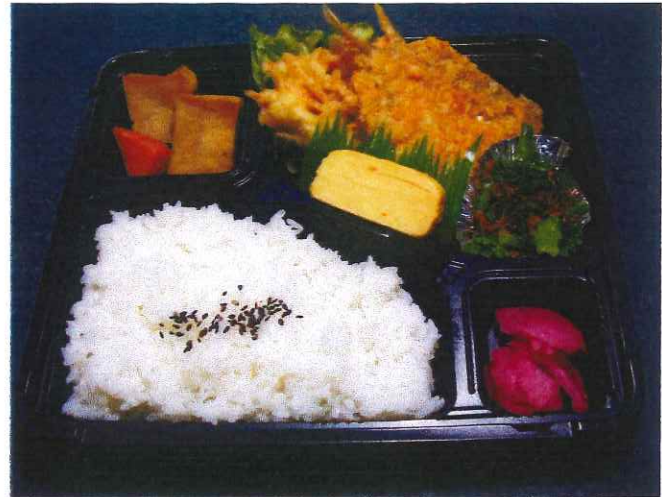
お茶付き弁当(アジフライ)600円

ごはん 漬物 さば味噌煮 野菜のかき揚げ 玉子焼き 菜の花ゴマ和え きんぴらごぼう 他