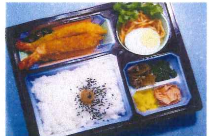
エビフライ弁当 780円