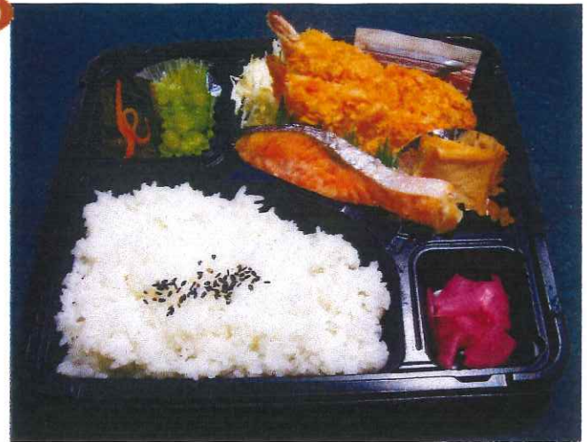
お茶付き弁当(エビフライ)600円

おにぎり2個 漬物 玉子焼き きんぴらごぼう コロッケ シュウマイ いんげんゴマ和え 他