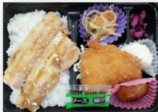
E.豚カルビ焼き・アジフライ・ミニハンバーグ