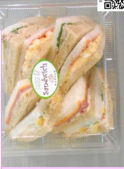
クラシックサンドBOX 702円