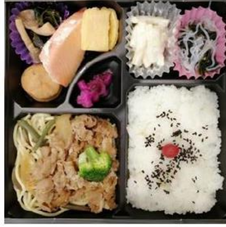
IM-4 特選牛すき幕の内