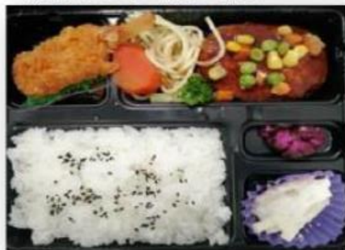
A.デミハンバーグ・串カツ・白スバ