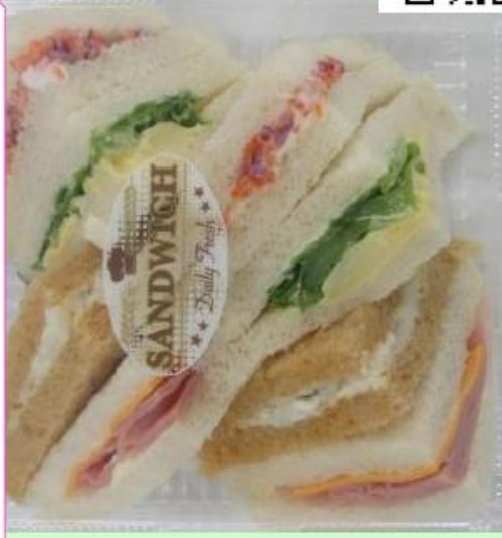
バラエティサンドBOX 594円

※各種最低注文数あり。それ以下の場合はご相談ください。 ※アレルギー対応しておりませんので、成分表をご参照ください。 ※該当する場合は、おむすびセット・おにぎり各種にてご用意可能です。 ※ドリンク各種別売 (HPご参照ください)