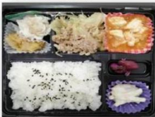
C.牛焼肉・麻婆豆腐・焼売