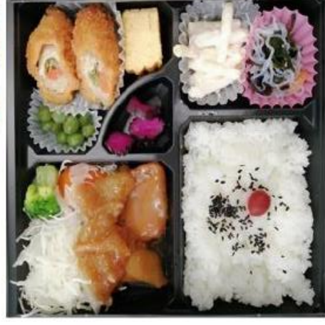
IM-5 ダブルチキン・和風肉巻煮

コンタミネーションとは、各保健所の指導で食品製造会社が裏面シールに扱っている食料の全てを記載する事。 (例) エビ・カニ入っていないなくても裏面には記載