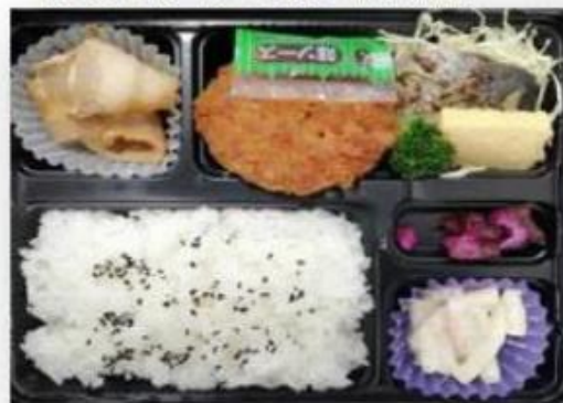
F.メンチカツ・豚バラ焼き・魚の塩焼き