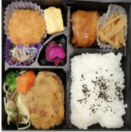
IM-3 おろしハンバーガー