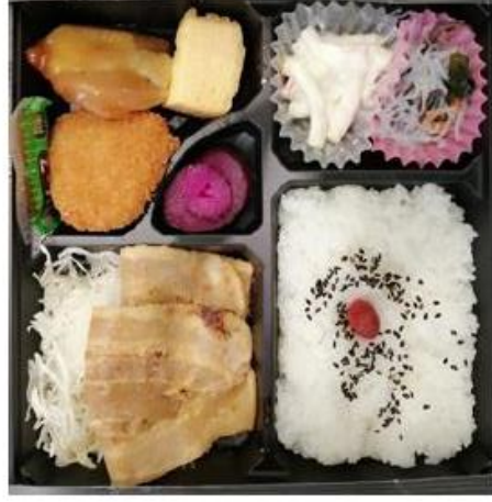
IM-2 豚生姜焼き・トンカツ