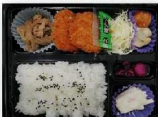
B.ダブルトンカツ・牛すき・焼売・肉団子