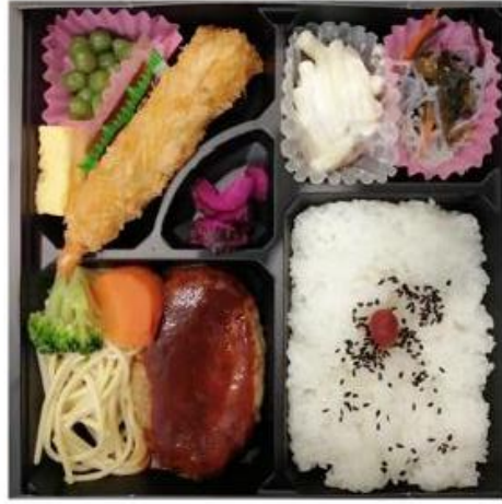
IM-1 ハンバーガー・エビフライ