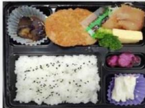
D.鶏の照焼・カボチャコロケ・玉子焼き