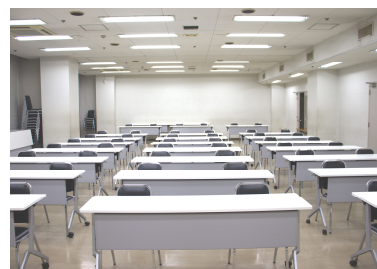
203 会議室 (机 新調)